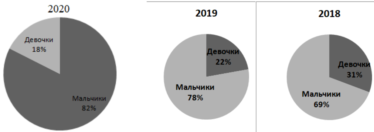
Диаграмма с характеристиками (девочки/мальчики)

Вывод: Сохранность контингента в МБУДО г.Астрахани «ДЮСШ № 10» составляет 100%, что свидетельствует о выполнении муниципального задания.