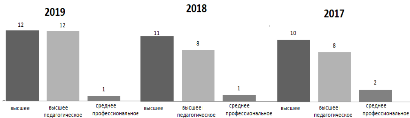
Диаграмма с характеристиками (Образование педагогических работников)